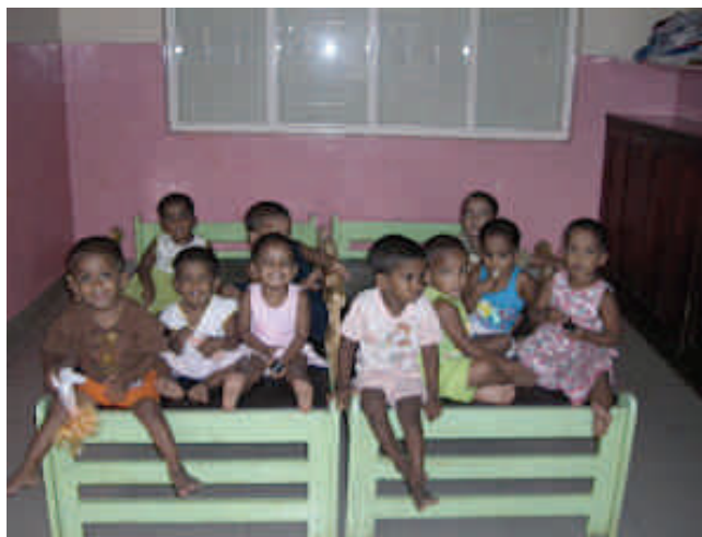
Les enfants après la douche à l'orphelinat de Sarvodaya