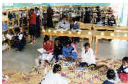
Occupation lecture à la bibliothèque située dans le bâtiment rénové