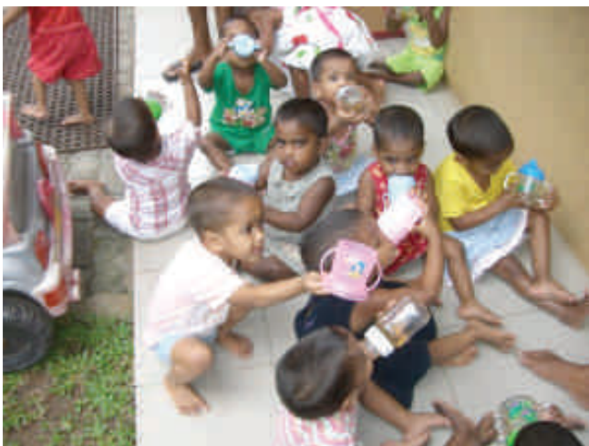
Tea time pour les enfants de l'orphelinat de Sarvodaya

Pour mon dernier mois, direction Nugegoda encore plus près de Colombo et Mount Lavinia. Durant cette période j'ai vécu au sein d'une famille chaleureuse et magique. Je fus très bien accueillie. J'ai pu y découvrir la vie en famille, la cuisine et la vie que j'avais pu appréhender à Moratuwa. J'ai travaillé auprès du Probation Office. Ce dernier mois m'a permis d'apprendre et de comprendre la législation de l'adoption internationale et locale. D'en voir les enjeux et les difficultés. J'ai pu comprendre la procédure, voir des dossiers. J'ai pu parler avec différents professionnels chargés de l'adoption, du parrainage...de même qu'avec des professionnels chargés de l'action sociale. Ce qui fut intéressant car ayant fait un stage au sein de l'Aide Sociale à l'Enfance, cela m'a permis de comparer nos actions, missions et organisation auprès des personnes.