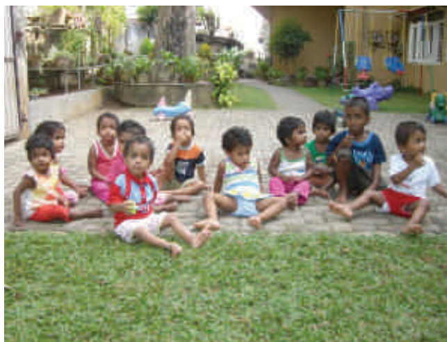
Petit goûter à l'orphelinat de Sarvodaya