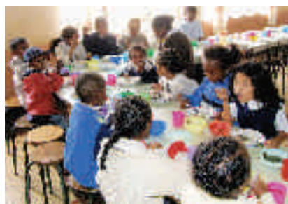
Le groupe d'enfants parrainés à la cantine le mercredi