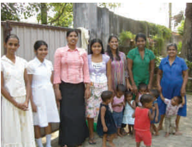
Une partie de l'équipe qui travaille au sein de l'orphelinat de Sarvodaya à Moratuwa

Puis nous avons dû nous séparer puisque je devais aller travailler à Sarvodaya... Mais une semaine après mon départ de Bentota, j'y revenais pour voir tout le monde.