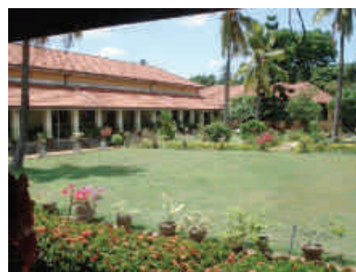
Le couvent Good Shepherd