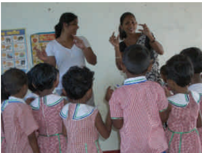
Chant avec les enfants à l'école du village de Gonegola