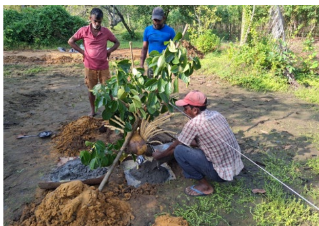
Pose de la première pierre