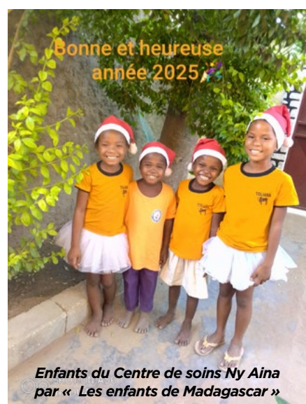
Enfants du Centre de soins Ny Aina par « Les enfants de Madagascar »

C'est grâce à Kasih Bunda, à vous tous qui êtes engagés dans les parrainages que je fais le suivi de chaque filleul ainsi que la disponibilité du Père Carton qui facilite ma responsabilité, que je reconnais n'est pas facile vis à vis des différentes situations familiales.